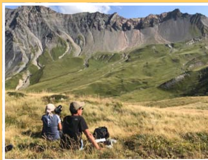
Conditions estivales cette année le jour J, même en soirée en altitude !

47 vautours fauves minimum 2 vautours moines