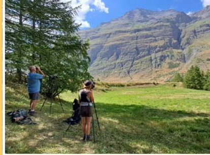
Entre éloignement et contre-jour, les conditions d'observation s'avèrent parfois compliquées, autant pour suivre les mouvements dans l'après-midi que pour le décompte final.

2022 – 364 vautours fauves 2021 – 285 vautours fauves 2020 – 503 vautours fauves 2019 – 355 vautours fauves 2018 – 398 vautours fauves 2017 – 631 vautours fauves (dérochement en Savoie) 2016 – chiffres non représentatifs pour cause météo 2015 – 151 vautours fauves (dérochement sur département voisin) 2014 – 295 vautours fauves 2013 – 182 vautours fauves 2012 – 195 vautours fauves 2011 – 148 vautours fauves