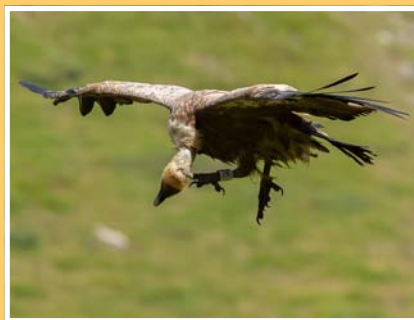
Un voyageur au long cours qui passait par là... ce VF qui participait à la curée en Hte-Maurienne est né dans la colonie des Baronnies en 2010 (info bague).