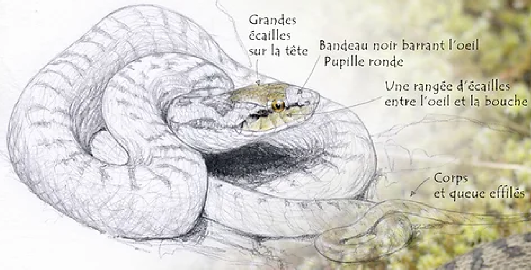
Coronelle lisse ( Coronella austriaca ) 50 cm à 70 cm