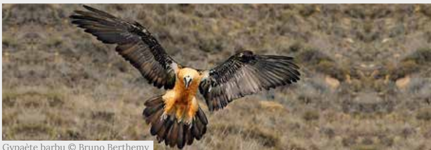
Gypaète barbu

Il peut être très curieux mais devient très craintif lorsqu'on s'approche de son territoire de reproduction. Il est considéré comme étant très sensible au dérangement de nature anthropique (abandon des œufs, prédation, chute accidentelle...).