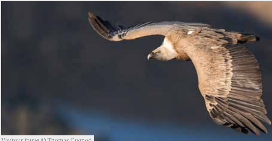
Vautour fauve

Ce grand rapace nécrophage se reproduit de décembre à août et niche en colonie dans les falaises. Le dérangement peut compromettre les chances de succès d'envol du jeune (1 seul par an).