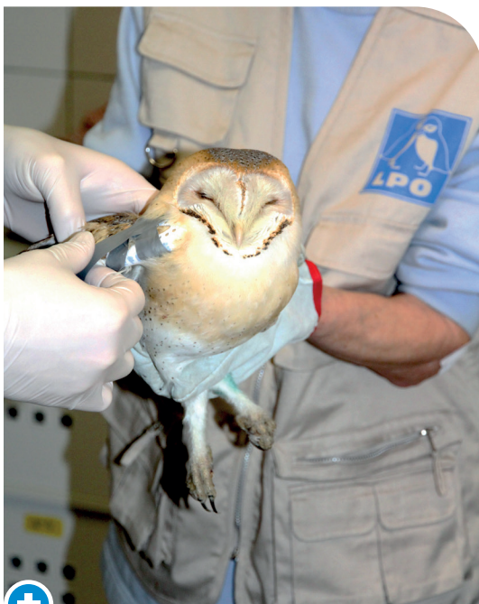
Atteinte sur une chouette effraie