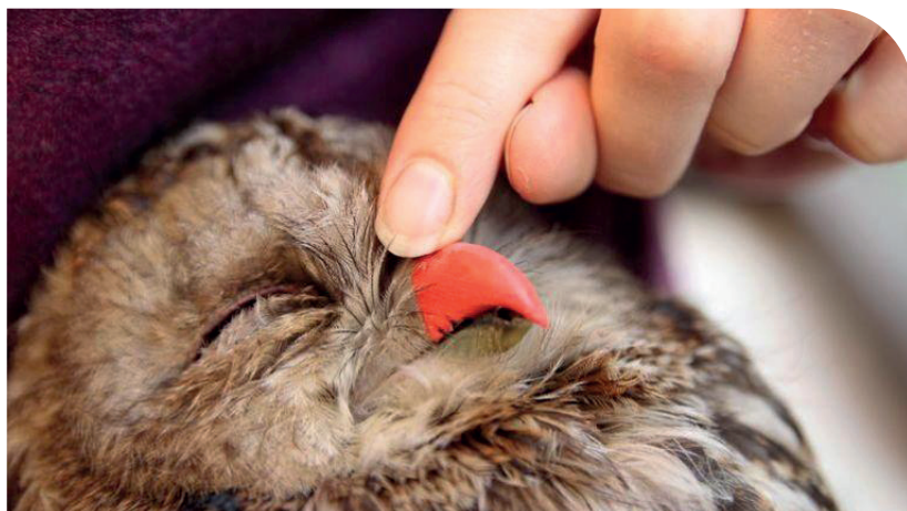
Prothèse 3D sur une chouette hulotte

Le Centre constitue à ce jour la seule réponse à la souffrance d'oiseaux sauvages au sein des quatre départements auvergnats, donnant à ses missions un statut d'utilité publique.