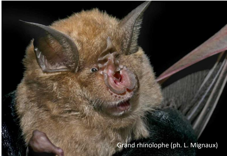
Grand rhinolophe

1 ind. est observé en hibernation dans une grotte le 17/01 à Mégevette (C. Lavorel, O. Sousbie, S. Fauvel, JCL) et 6 ind. le 18/01 à la grotte de la Diau à Thorens-Glières, dans la cadre du suivi hivernal avec les spéléologues (C. Dodelin, C. Lavorel, O. Sousbie, S. Fauvel, M. Schneider, E. Fradin, JCL). Lors du suivi des colonies de reproduction,