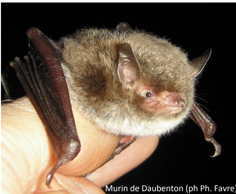
Murin de Daubenton

En hibernation dans des grottes, 1 ind. est noté le 8/01 à Leschaux (C. Dodelin, C. Nant, J. Nant), 1 ind. le 17/01 à Mégevette (C. Lavorel, O. Sousbie, S. Fauvel, JCL) et 1 ind. le 18/01 à Thorens-Glières (C. Dodelin, C. Lavorel, O. Sousbie, S. Fauvel, M. Schneider, E. Fradin, JCL). En acoustique, il est contacté à plusieurs endroits les 11/05 et 29/06 sur le Thiou à Annecy (L. Palix, TG, JCL, XBC), le 10/06 à Vallorcine, le 20/06 à