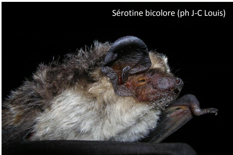
Sérotine bicolore

12 ind. franchissent, après avoir été capturés, le col de Bretolet durant l'été et l'automne 2014. Rapport 2014 (Jahresbericht 2014 der Beringungsstation) Marco Thoma et Sarah Althaus.