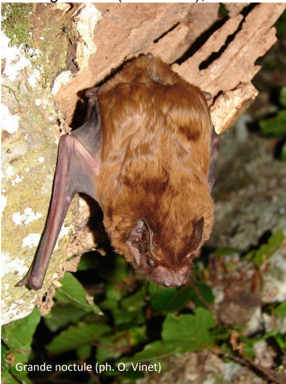
Grande noctule