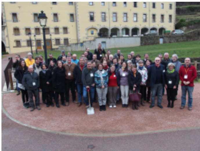
Les associations LPO d'Auvergne et de Rhône-Alpes à St Chamond, lors du séminaire de travail

Des représentants des LPO d'Auvergne et de Rhône-Alpes se sont rencontrés à St Etienne le 29 novembre 2014. Suite à cette rencontre, les LPO d'Auvergne et de Rhône-Alpes vont travailler ensemble pour écrire un projet commun pour la biodiversité. La réforme territoriale est vue comme une opportunité pour réfléchir à un projet associatif partagé. Il s'agit de se tenir prêt à proposer « le projet de la LPO pour la biodiversité » et rester force de proposition face à nos nouveaux interlocuteurs potentiels (grande région, Métropoles, intercommunalités...).