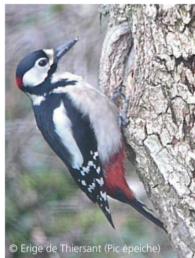
© Erige de Thiersant (Pic épeiche)