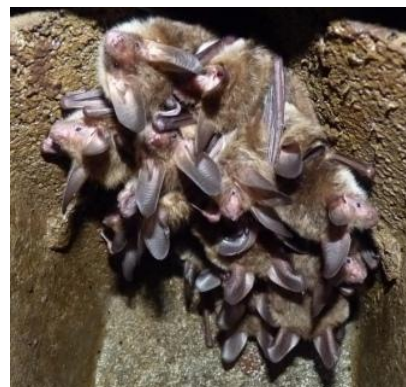
Murin de Bechstein dans un gîte artificiel de FrancLens (CP)

Le tableau suivant décline les résultats obtenus sur 6 sites équipés en gîtes artificiels et nichoirs.