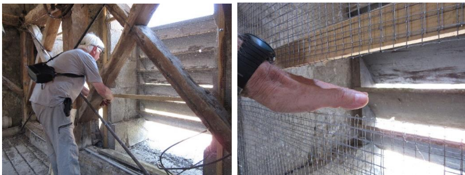
Réalisation d'ouvertures permettant aux chauves-souris d'accéder à leur gîte de reproduction dans l'église de Frangy (JCL)