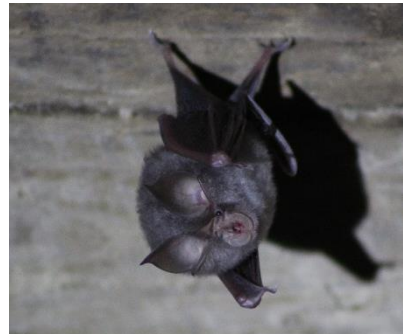
Petit rhinolophe à Cusy (T.Goutin)

La réalisation de 2 ouvertures de 6 cm de haut a permis aux chauves-souris des colonies de Frangy de sortir plus facilement, toutes les ouvertures du gîte ayant été grillagées (CP, JCL).